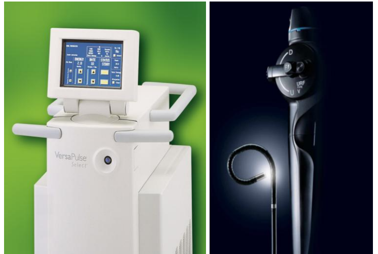
(ポストン VP Select) (オリンパス Type V)

最新のレーザーと軟性尿管鏡を用いて軟性尿管鏡下経尿道的結石碎石術（f-TUL）を施行しております。